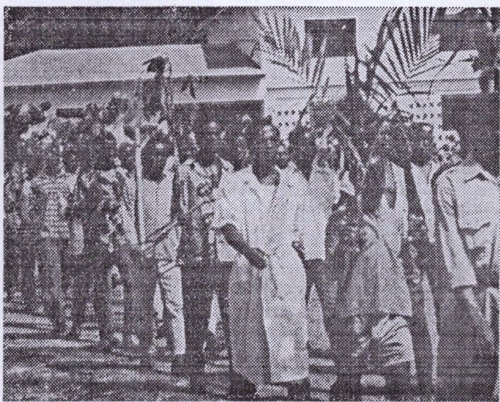
Sur notre photo : le défilé des travailleurs de Kankan. Ils portent des branches de palmier.